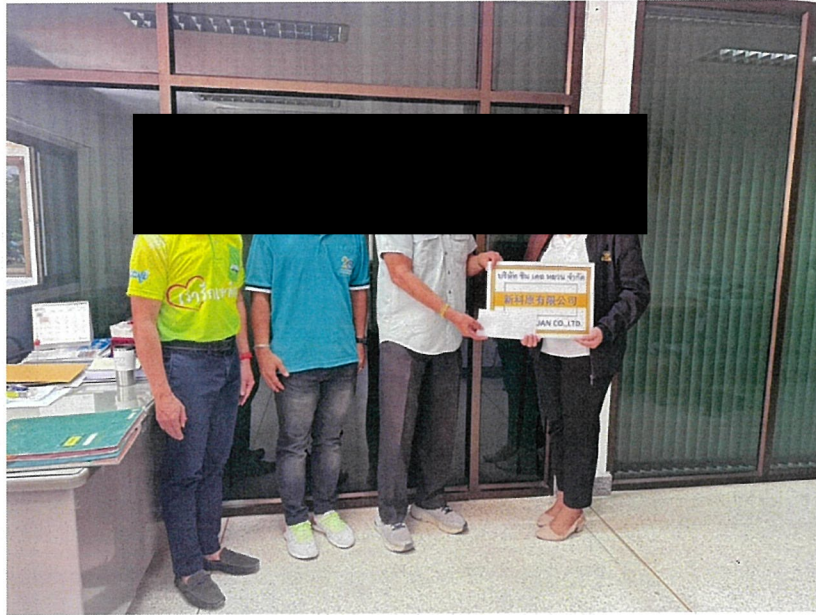
สนับสนุนการจัดซื้อสิ่งของที่จำเป็นต่อการดำรงชีพ ให้กับผู้ป่วยติดเตียง ผู้สูงอายุ และผู้ด้อยโอกาสทางสังคม อบต.เขาคันทรง