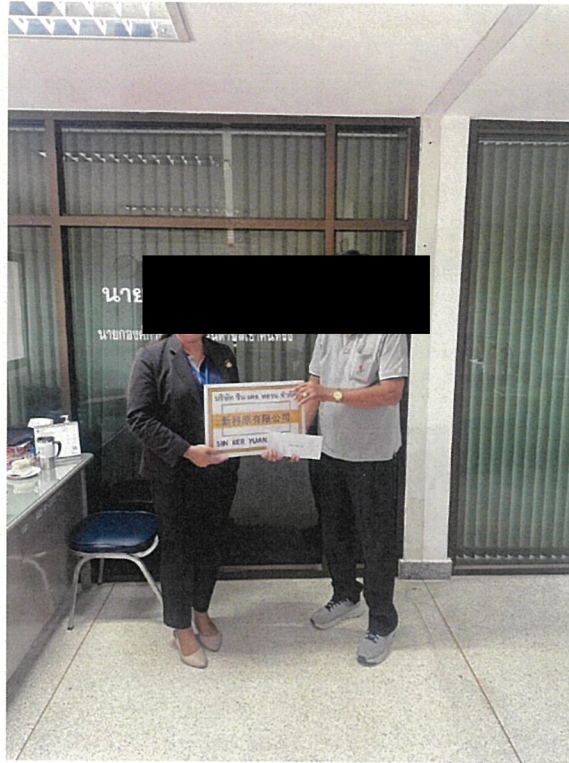
สนับสนุนโครงการฝึกอบรมพัฒนาศักยภาพ อสม.ประจำหมู่บ้านและแกนนำชุมชน อบต.เขาคันทรง