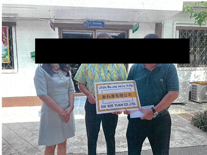
สนับสนุนโครงการส่งเสริมศักยภาพผู้สูงอายุ อบต.ตาสิทธิ์