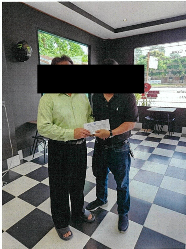
ร่วมทำบุญทอดผ้าป่ากองทุนแม่ของแผ่นดิน