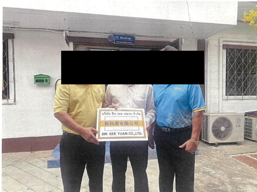
สนับสนุนโครงการส่งเสริมกิจกรรมผู้สูงอายุ อบต.ตาสีห์