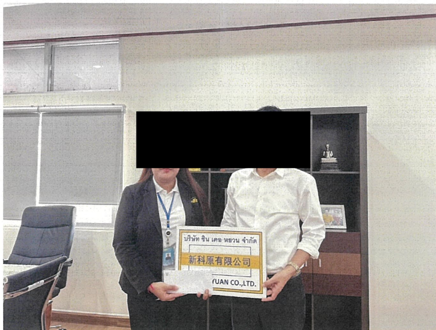
สนับสนุนการจัดกิจกรรมงานสัปดาห์พืชมาน อำเภอลวกแดง