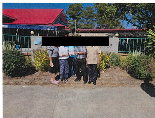
สนับสนุนของขวัญให้กับ รพ.สต.บ้านหนองบอน

ในการทำบุญครอบรอบของ รพ.สต.บ้านหนองบอน และจัดกิจกรรมงานเลี้ยงให้กับกลุ่ม อสม.