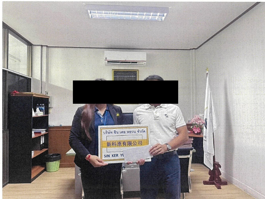
สนับสนุนการดำเนินกิจกรรมช่วงเทศกาลสงกรานต์ อำเภอลวกแดง