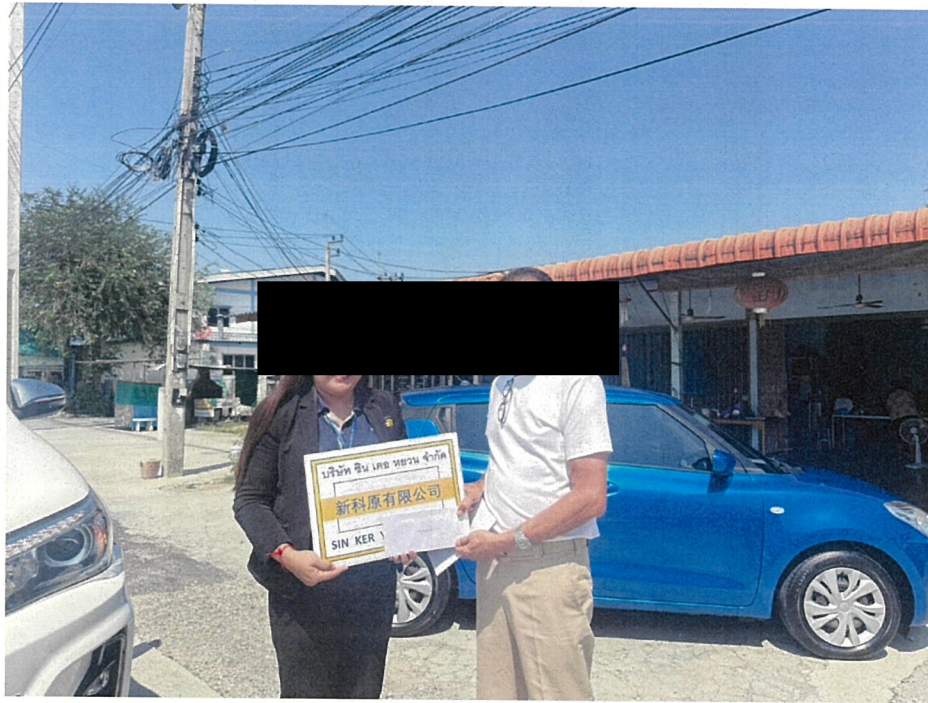
สนับสนุนการจัดงานประเพณีสงกรานต์และวันผู้สูงอายุ หมู่ 6 ต.คลองกiew