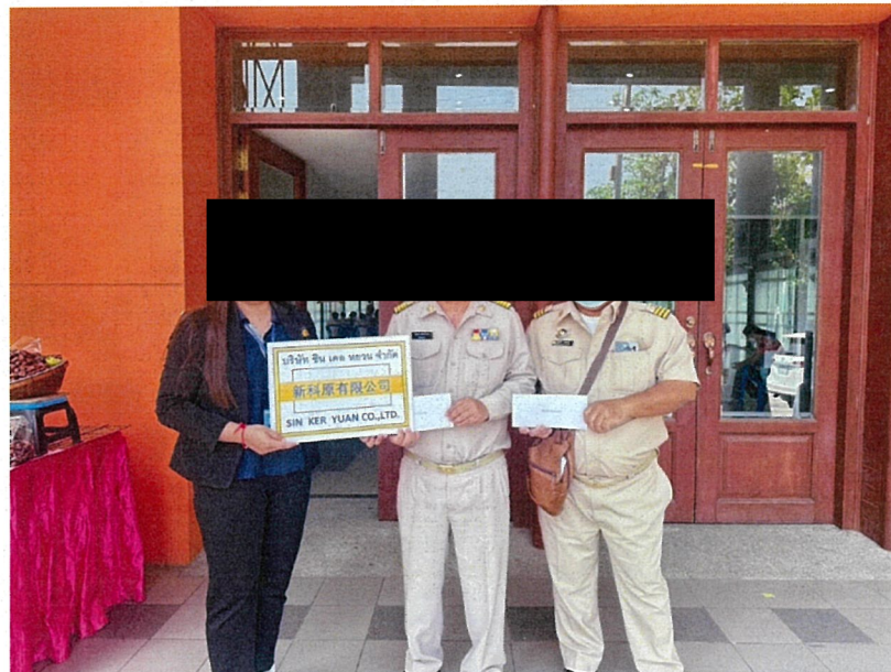
สนับสนุนการจัดงานประเพณีสงกรานต์และวันผู้สูงอายุ หมู่ 5 และ หมู่ 7 ต.คลองกิว