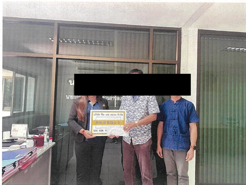
สนับสนุนโครงการสืบสานวัฒนธรรมประเพณีร้อยด้วยใจสายใยผู้สูงอายุ อบต.เขาคันทรง