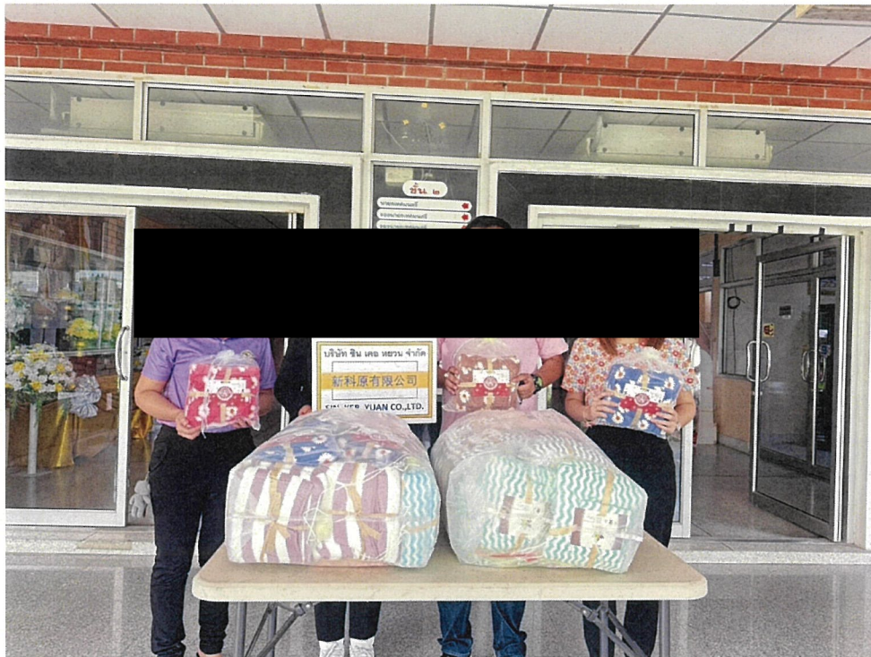
สนับสนุนของรางวัลให้กับเทศบาลตำบลจอมพลเจ้าพระยา งานประเพณีสงกรานต์และวันผู้สูงอายุ